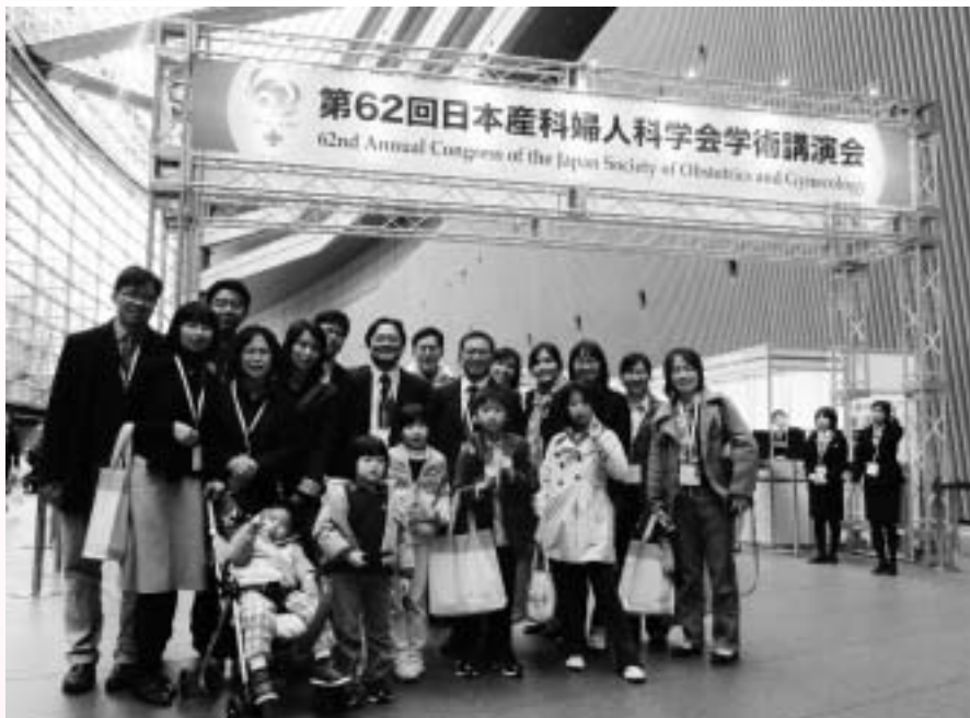
圖二 高雄長庚婦產部與會人員大合照