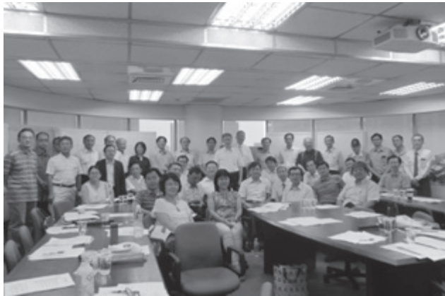
105年8月20日審查醫師共識會議

「公開具名審查」雖只是試辦，但這是健保審查制度變革的一個新紀元，期待大家抱持創造歷史的決心，一同來落實「具名審查」制度，千萬不要再走「黑箱審查」或「恐龍審查」的回頭路。佛祖要庇庇台灣的好醫生！