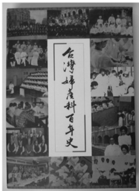
發行人 蔡明賢 主 編 黃思誠